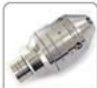
空心杆系列超细喷嘴(4P30-3)