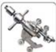
超细超高压系列喷嘴(100-4)