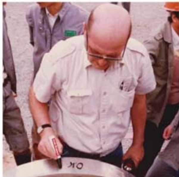
外国专家检测合格写下 OK 字样

供气、燃煤均达到新装炉水平。这一结果引起了市经委、能源办、机械局、劳动局等部门的轰动。因节能效果好，市经委、能源办特地推荐我公司携带 Lan-5 硝酸缓蚀清洗新技术到东北经济区首届节能展览会参展，在全市范围内召开 Lan-5 硝酸缓蚀清洗新工艺节能效果现场会，收到了非常好的宣传效果。