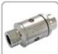
空心杆系列超细喷嘴(SR00W-05)