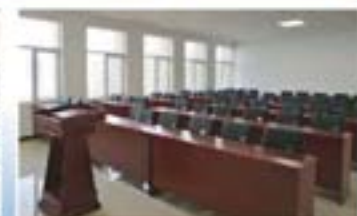
高压水射流学术交流及培训中心