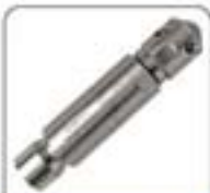
空心杆系列超细喷嘴(53M-45)