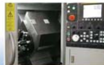
进口高精度车削中心