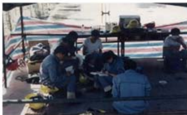
清洗工作人员在现场进行技术讨论学习

地进行技术推广介绍；另一方面，有的企业锅炉垢层几十毫米仍凑合着继续用，把热效降低能耗增加视为正常现象；有的企业垢层严重被迫停车后，用气焊割开夹套，人工除垢后再焊上，如此反复，停工减产、劳心费力不说，设备效能大打折扣，安全性也成了问题；也有的企业依靠国外50年代使用的盐酸溶液进行清洗，效果不佳，又容易腐蚀金属设备；还有更多的企业则频繁停车检修。