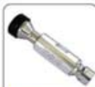
超细超高压系列喷嘴(100-100)