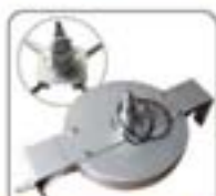
高压水射流清洗系统