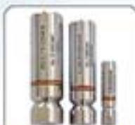
新型交叉打蜡专用超细喷嘴