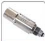
空心杆系列超细喷嘴(SC3000)