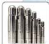
“小喇叭”系列超细雾化喷嘴