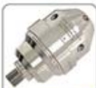
超细超高压系列喷嘴(150-1)