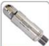
空心杆系列超细喷嘴(5-10bar)