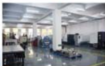
天津福祿公司生产车间