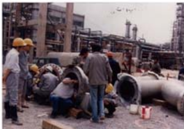
国外专家在现场仔细进行清洗结果检测

清楚的记得，当时在兰州胜利饭店（现兰州宾馆老楼）参加化工部化工机械研究院化学清洗总公司（即蓝星公司前身）组织的清洗技术培训。历时十多天，学习了包括 Lan-5 硝酸专用缓蚀剂与硝酸缓蚀清洗技术在锅炉清洗中的应用。