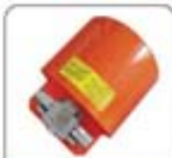
空心杆系列超细喷嘴(FV2800R)