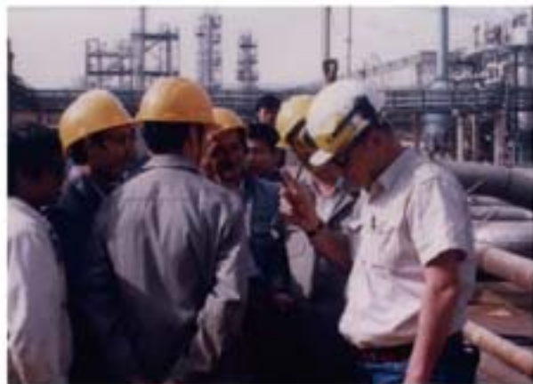
对中国工业清洗人摇着手指的国外专家