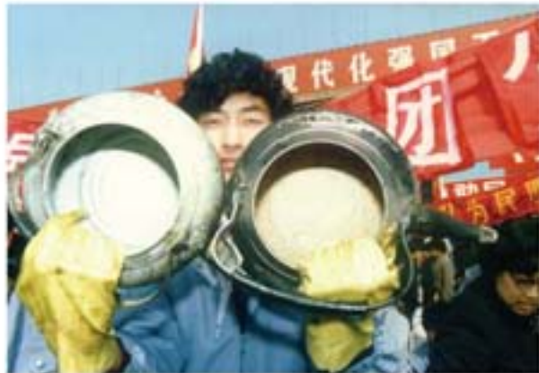
清洗茶壶（左右为清洗后茶壶的对比）

当时，在青海西宁，由清洗一把茶壶收入两毛钱为“契机”，成功吸引来西宁市防疫站锅炉清洗业务的故事，早已成为清洗行业广为人知的佳话。