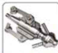
超细超高压系列喷嘴(100-300)