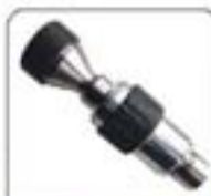
超细超高压系列喷嘴(100-100)