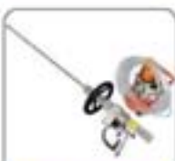
高压水射流清洗系统(200000-4)